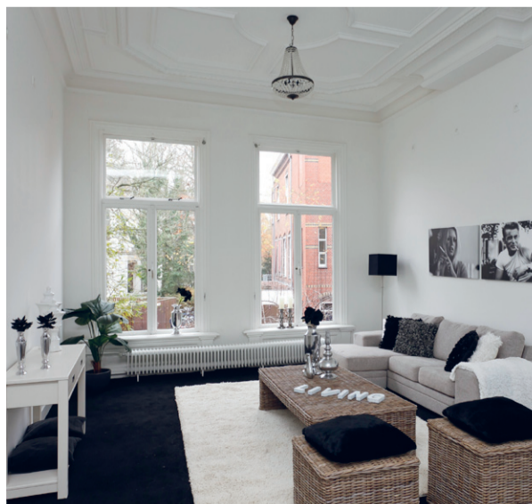
Lichte woonkamer met hoog plafond.

De makelaars van de NVM Makelaars met passie