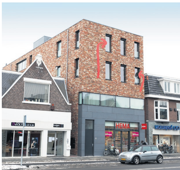
HEMA als benedenburen.