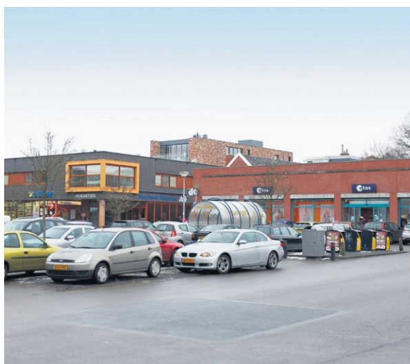
Op deze foto torent het appartementengebouw boven Winkelcentrum Helpman uit.

De makelaars van de NVM Makelaars met passie